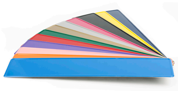
► Einfarbige Fun-Schilder-Rohlinge

Alle Platinen können mit den am Markt vorhandenen Heißsiegelmaschinen und Farbwalzen (nur mit K-Lack) eingefärbt werden.